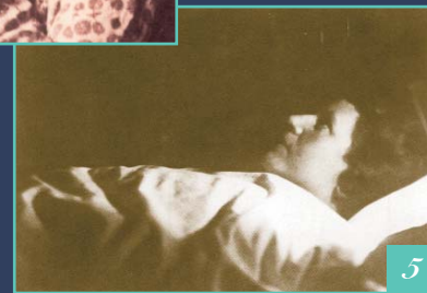
5 Maria Aristeo pregando.

maltrattò e offese in ogni modo, tentando più volte di ucciderla. Si convertì solo all'ultimo. Appena sposata, andò a vivere nella casa dei suoceri, commercianti benestanti, con un ben avviato forno, macelleria e negozio di alimentari. Questa famiglia, nonostante il benessere, era estremamente divisa, contraria alla religione e alla morale cristiana, con bestemmie e derisioni condivise da tutti. Divisioni, odi e malavita la portarono ben presto alla rovina. Più che come nuora fu accolta come donna di servizio per i lavori più umili, penosi e pesanti, quelli che gli stessi garzoni rifiutavano. In tutto il peggio toccava sempre a Lei. Più volte saltò pasto, perché, nonostante lavori impostile all'ultimo momento, quando tutti erano a tavola, non le lasciavano nulla. Non poteva dire nulla perché subito zittita malamente con insulti, derisioni, parole volgari. Il marito conduceva vita viziosa, violento, prepotente e dedito al vino, frequentava altre donne. Normalmente chiamava la moglie "carogna fetente", "carogna schifa" e altri titoli simili. Mai una gentilezza, sempre male parole, sovente percosse.